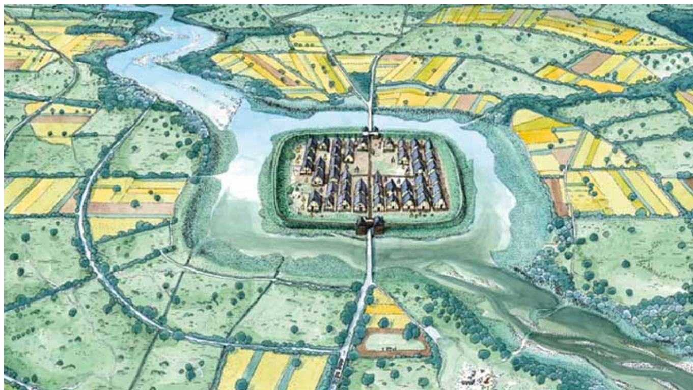
Ricostruzione della Terramara di Montale